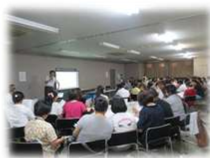
30.7.22開催の飯田会場の様子