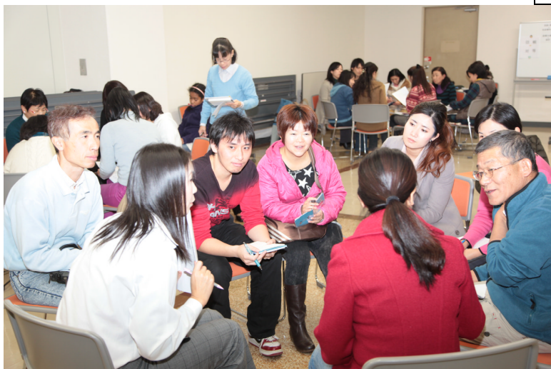
ロールプレイ演習風景(23年度)