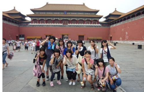
(故宮 圧倒的な歴史と文化に触れる)